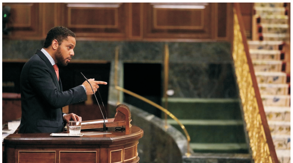
Ignacio Garriga en el Congreso de los Diputados

No sé si será o no. Lo que tengo claro es que Vox ha sido el movimiento que ha contribuido a acabar con políticas de izquierda, como en Andalucía. Defendemos lo mismo en todo el territorio nacional. Las familias están pagando la inseguridad, la okupación se ha convertido en una actividad delictiva rutinaria por la connivencia del separatismo y la izquierda. Hay que dar a los catalanes voz a sus problemas reales y denunciar esa Cataluña que ha dejado de lado la prosperidad, para dar paso a la ruina por los delirios separatistas. Abanderan el