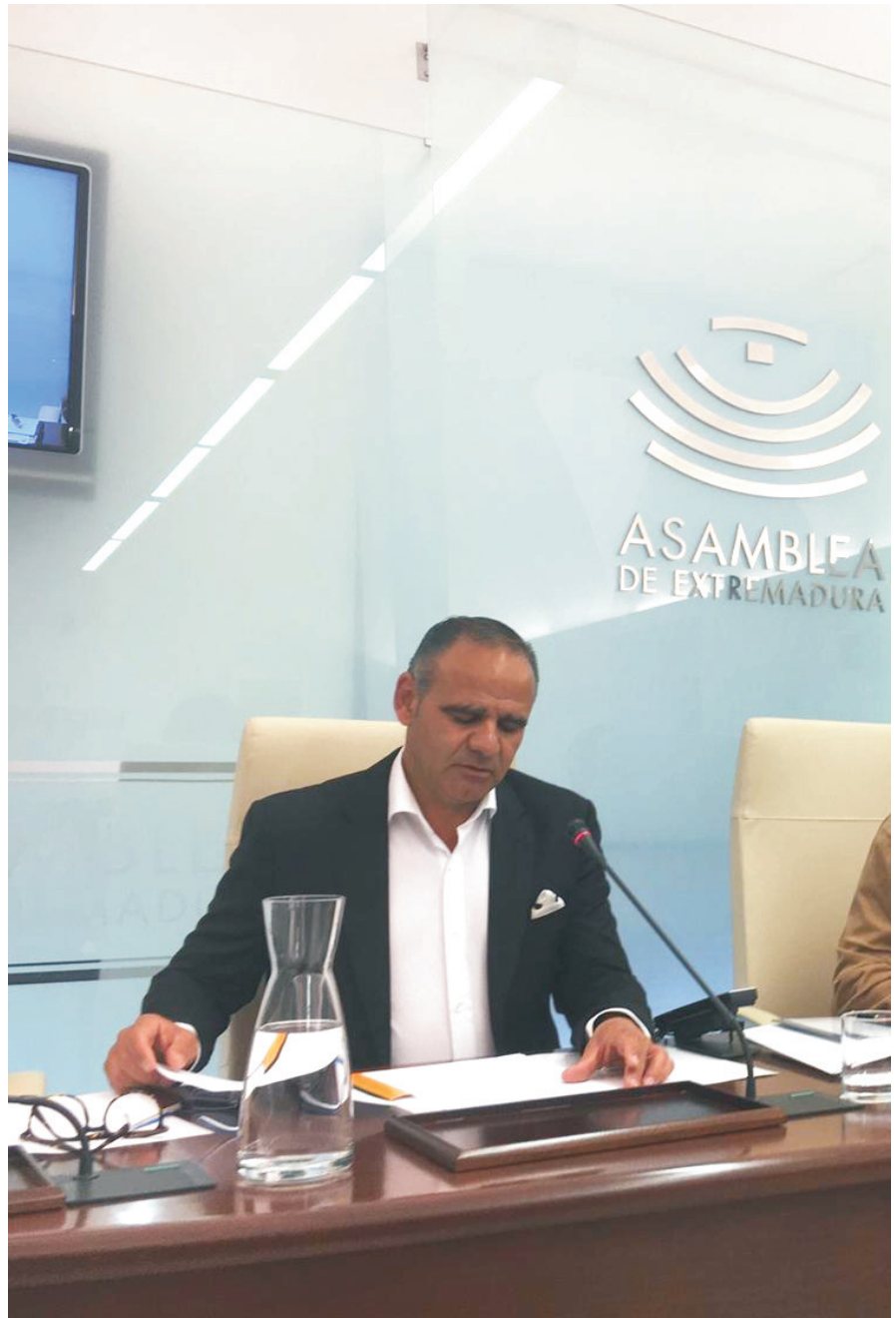
Ángel Borreguero presidente provincial

Por otro lado, VOX solicita que se controle la labor del personal eventual, ya que no es razonable que su salario sea abonado por la Cámara y su función real este encuadrada en la estructura de alguno de los partidos políticos tradicionales.