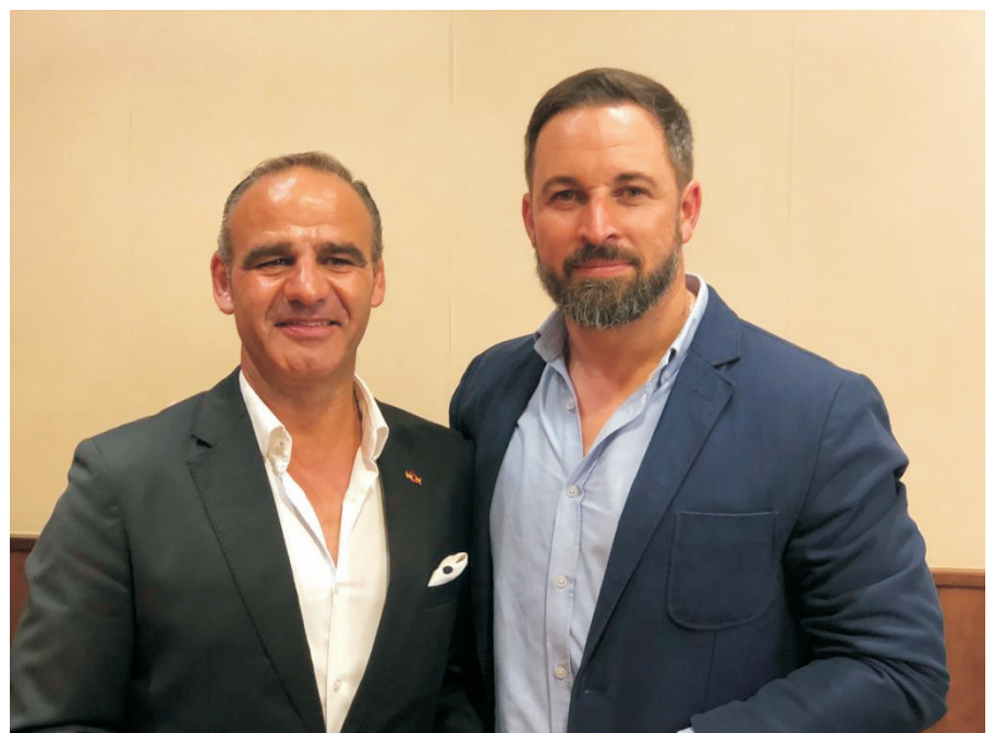
Ángel Borreguero junto con Santiago Abascal

«Las restricciones a la libertad mayores del mundo. Los peores datos sanitarios del mundo. Y ahora la mayor recesión del mundo. Los diputados que apoyen este gobierno serán responsables de la ruina y la muerte . Así se lo diremos en el Congreso. Los españoles se lo dirán en la calle», ha señalado en su perfil de Twitter.