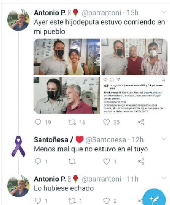
Insultos del exconcejal socialista a Santiago Abascal

Desde VOX no vamos a tolerar que se ataque de una manera tan miserable a nuestro presidente y exigimos al pleno municipal la inmediata reprobación del exconcejal Antonio Parra por los insultos realizados contra el líder de la tercera fuerza política de España.