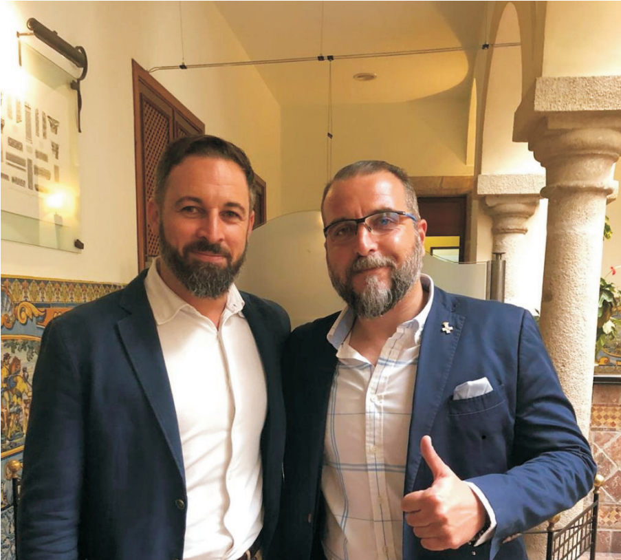
Gabriel Viñepla Vicesecretario de Organización junto con Santiago Abascal

El pasado jueves 6 de agosto nuestro presidente nacional Santiago Abascal realizó una parada en la localidad de Monesterio.